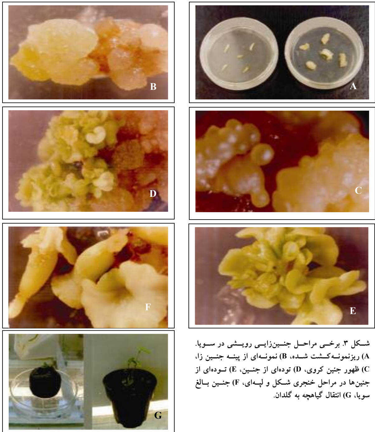
شکل ۳. برخی مراحل جنین‌زایی رویشی در سویا. (A) ریزنمونه کشت شده، (B) نمونه‌ای از پینه جنین‌زا، (C) ظهور جنین کروی، (D) توده‌ای از جنین، (E) توده‌ای از جنین‌ها در مراحل خنجری شکل و لپه‌ای، (F) جنین بالغ سویا، (G) انتقال گیاهچه به گلدان.