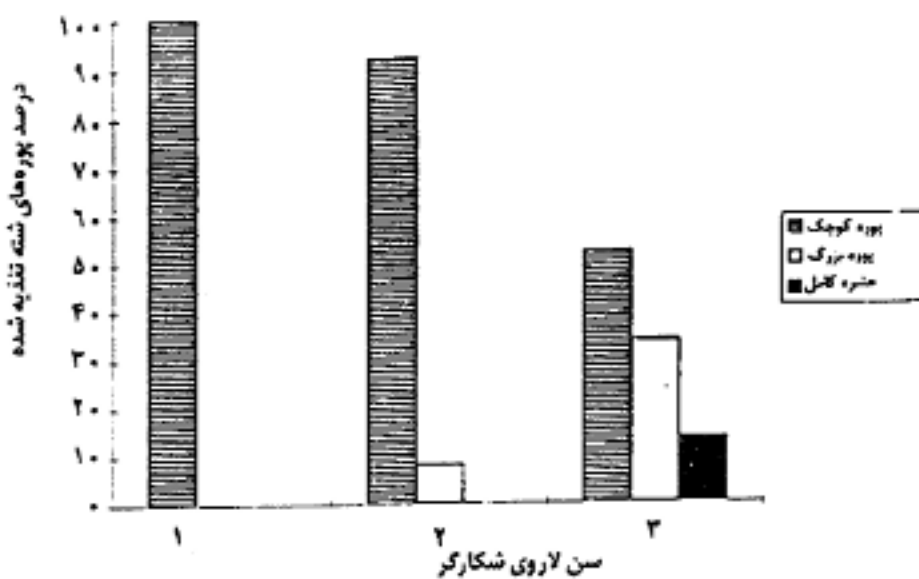
شکل ۲. ترکیب سنی شکار (شته سیاه باقلا) برای لاروهای شکارگر Leucopis glyphinivora Tanas.