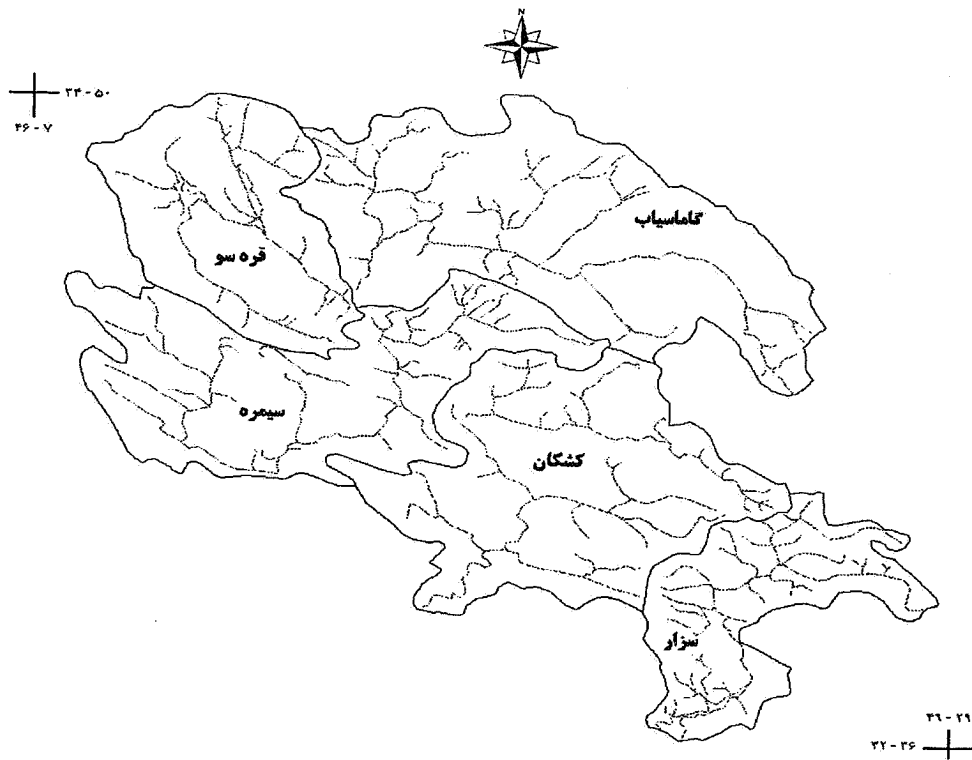
شکل ۱. حوزه‌های آبخیز مورد مطالعه