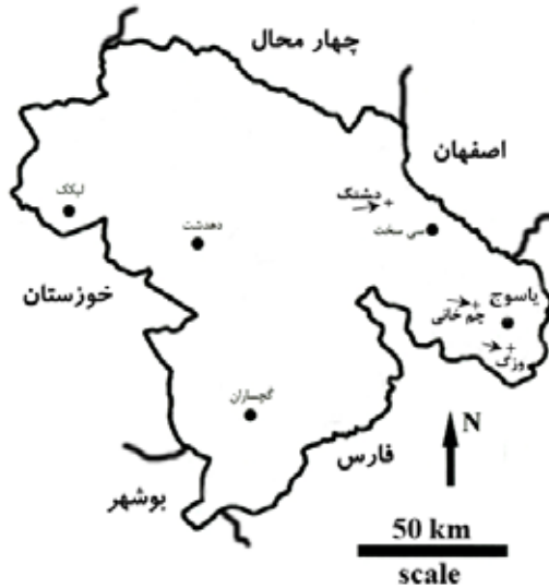
شکل ۱. موقعیت مناطق مطالعاتی در استان کهگیلویه و بویراحمد (نشان داده شده با پیکان)

تفاوت میان میزان کربنات کلسیم معادل در خاک سایه‌انداز و خارج آن در مناطق مطالعاتی الگوهای متفاوتی را نشان داده است. در حالی که این اختلاف در منطقه وزگ بی معنی بوده و در مناطق دشتک و چمخانی به ترتیب در سطوح ۱٪ و ۵٪ معنی‌دار بوده است. تغییرات میزان کربنات کلسیم معادل نسبت به عمق نیز در هر سه منطقه معنی‌دار بوده است. نتایج به دست آمده نشان می‌دهد که میانگین میزان کربنات کلسیم معادل در عمق ۲۰-۳۰ سانتی‌متر مناطق وزگ و چمخانی و اعماق ۴۰-۶۰ و ۲۰-۴۰ سانتی‌متر خاک منطقه دشتک معنی‌دار بوده است. در سایر مناطق و عمق‌ها میانگین اختلاف‌ها معنی‌دار نبوده است (جدول‌های ۲ و ۴). تفاوت میان میزان کربن آلی و نیتروژن کل در خاک سایه‌انداز و خارج آن و هم‌چنین بین