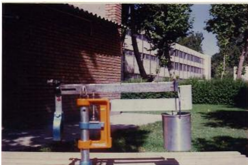
شکل ۱. دستگاه اندازه‌گیری مقاومت کششی