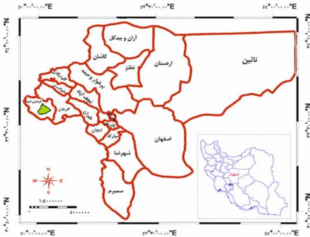
شکل ۱. موقعیت جغرافیایی منطقه مورد مطالعه