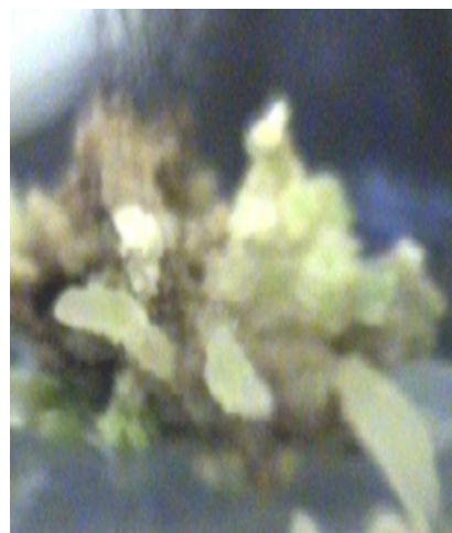
شکل ۱. ایجاد جنین سوماتیک در کالوس‌های یونجه در اکسین و اتینل استرادیول (محیط کشت M6)