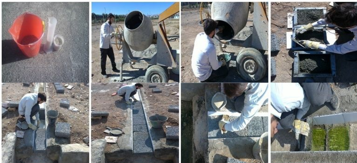
شکل ۴. مراحل تهیه بتن، قالب‌ریزی و قرارگیری بتن‌ها در کانال

آسیبی به جداره کانال وارد نیاید. در هر بار آزمایش تعداد ۱۱ مکعب در کانال قرار داده شد. نکته دیگر آنکه در هنگام ساخت قالب بتن‌ریزی، عرض قالب ۵/۰ سانتی‌متر کمتر از کانال گرفته شد؛ دلیل این امر سهولت در جای گذاشتن و برداشت مکعب‌ها در کانال می‌باشد. فضای ایجاد شده با شن عبوری از الک ۱۴ به همراه مقداری سیمان (جهت پایدار شدن شن‌ها) پر شد. این مراحل انجام کار در شکل ۴ نشان داده شده است.