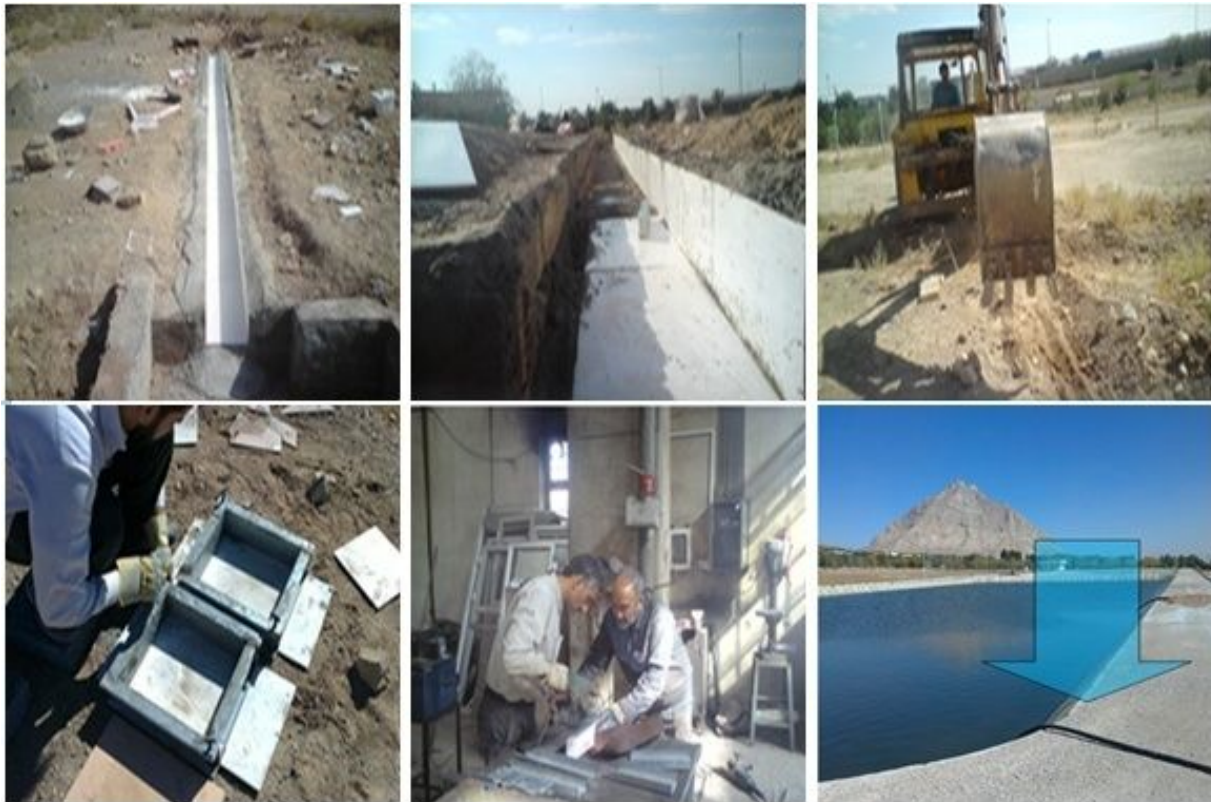
شکل ۳. مراحل گودبرداری، تهیه قالب بتن، عایق‌بندی کانال و تنظیم جریان ورودی به کانال

آن‌که حفرات بتن کمی ریزتر شوند در سه مرحله، که در هر مرحله ۱۰ درصد وزن درشت‌دانه، ریزدانه به طرح اختلاط پایه اضافه شد (۱۵). در نهایت چهار طرح اختلاط برای بتن متخلخل در اختیار می‌باشد. در جدول ۱ مشخصات طرح اختلاطها آورده شده است. در اینجا منظور از ریزدانه، شن عبور کرده از الک ۴ و مانده بر الک ۲۰۰ می‌باشد و درشت‌دانه ذرات شن ۴/۷۵ تا ۱۲/۵ میلی‌متر می‌باشد. در این تحقیق عیار سیمان ۳۳۰ کیلوگرم در مترمکعب به‌طور ثابت در نظر گرفته شده است. همچنین آب مورد استفاده آب شرب بوده است. نکته دیگر که با توجه به جدول ۱ باید مد نظر قرار گرفته شود این‌است که با افزوده شدن ریزدانه با توجه به مشاهدات آزمایشگاهی درصد w/c افزایش یافته تا خمیر بتن به‌صورت یکنواخت تهیه گردد و سیمان‌ها به‌صورت گلوله‌ای در نیاید. البته این افزایش درصد در محدوده مجاز توصیه شده توسط ACI211.3R می‌باشد. برای ساخت نمونه‌ها، مقادیر مصالح مصرفی در بتن مطابق طرح‌های اختلاط به‌وسیله ظروف حجمی مدرج اندازه‌گیری شد