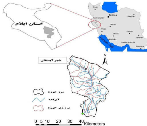
شکل ۱. موقعیت حوضه آبخیز دویرج در ایران

۴/۳۳۴ میلی‌متر می‌باشد. دمای هوا در فصل تابستان در این حوضه آبخیز، به‌خصوص در ناحیه جنوبی آن، بالا است. میانگین حداکثر دما ۶/۲۷ درجه سانتی‌گراد و میانگین حداقل دما ۷/۱۳ درجه سانتی‌گراد می‌باشد.