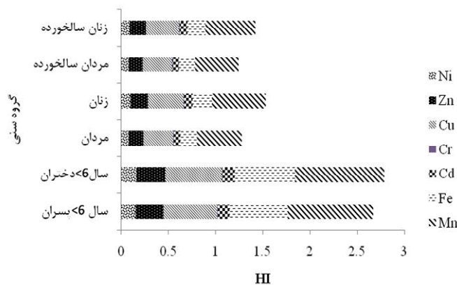
شکل ۳. شاخص خطرپذیری کل ناشی از مصرف محصولات کشاورزی (گندم، ذرت و سیب‌زمینی) در استان همدان

همچنین هو و همکاران (۱۵) گزارش کردند که میزان ورود Cd, Pb, Cu و Zn از طریق مصرف سبزیجات در نانجینگ چین کمتر از UL و مقدار THQ کمتر از یک برای کودکان و بزرگسالان می باشد که آنها بیان داشتند که عناصر سنگین از طریق مصرف سبزیجات سلامت مصرف کننده را تهدید نمی کند ولی بایستی به خطر تجمع در طولانی مدت عناصر سنگین مخصوصا در کودکان توجه شود. همچنین در ارتباط با ارزیابی خطر عناصر سنگین بر سلامت انسان از طریق مصرف محصولات کشاورزی و خاک می توان به مطالعه عقیلی و همکاران (۴ و ۵) در استان اصفهان و قم، یگانه و همکاران (۳۴) و (۳۵) در استان همدان و خوشگفتارمنش و همکاران (۲۰) در استان اصفهان اشاره کرد.