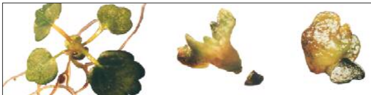
الف. رشد گیاهچه ۲ روز بعد از کشت ب. رشد گیاهچه ۴ روز بعد از کشت ج. رشد دانه‌های توت فرنگی ۷ روز بعد از کشت

تصویر ۲. مراحل جوانه‌زنی بذر نصف شده توت فرنگی حاوی گیاهچه در محیط کشت درون شیشه ( In vitro )