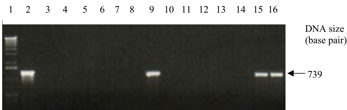
شکل ۵. نتایج آزمون PCR برای ریشه‌های مویین تراریخته BinOF2 برای تشخیص ژن GUS