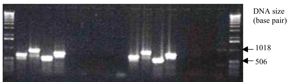
شکل ۱. نتایج PCR دو نمونه پلاسمید نو ترکیب pAM-FLOxF2R.2 با به اختصار pAMOF2 با آغازگرهای مختلف برای تأیید همسو بودن جهت ژن OF2 در مجاورت پروموتور CaMV35S

M 1 2 3 4 5 6 7 8 9 10 11 12 13 14 15 16 17 M