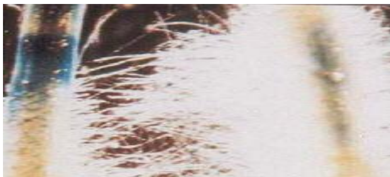
شکل ۴. ریشه‌های مویین تراریخته حامل ژن GUS با پروموتور CaMV35S پس از رنگ‌آمیزی. لکه‌های آبی در ریشه‌های مویین بیان ژن GUS را نشان می‌دهند.