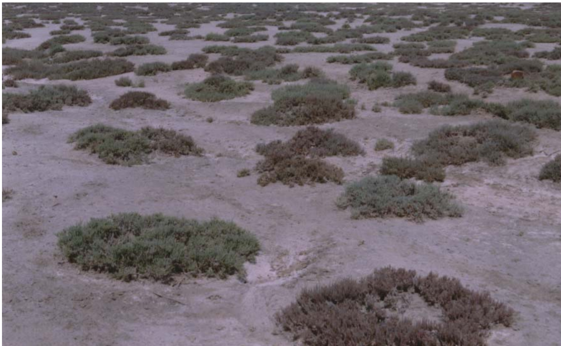
شکل ۳. سیمای تیپ گیاهی یک‌نواخت با غالبیت Halocnemum strobilaceum در منطقه دشت کرسیا

بیان کرد شورروی‌های گوشتی و آبدار مانند Halocnemum با مرگ آگاهانه قسمت‌هایی از بافت‌های گوشتی خود مقدار زیادی نمک را برای ادامه بقای از دست می‌دهند (۲۴). ایزمیل دریافت که میزان نمک محلول در اندام‌های مرده گیاه ۲۱/۵ درصد بود در حالی که میزان این املاح در قسمت‌های سرپا فقط ۵/۹ درصد بوده است (۲۶). باتانونی ضمن قرار دادن این گونه در گیاهان متحمل شوری، اشکال تطابقی آن با شرایط شوری را با تولید بافت‌های گوشتی، کاهش هدررفت آب از طریق چوب پنبه‌ای شدن اندام‌های مسن، تنظیم فشار اسمزی و افزایش تحمل بافت‌ها، سلول‌ها و اندام‌های خود نسبت به شوری بیان نمود. وی هم‌چنین ایجاد بافت چوب‌پنبه‌ای را در سطح اندام‌های مسن باعث ایجاد یک کشش برای ذخیره نمک در بافت‌های مرده بیان کرد (۲۰). باتانونی و ایوب برداشت علوفه توسط دام را از گیاهان شورروی گوشتی باعث کاهش شوری خاک دانسته و هم‌زمان با مصرف این گونه، مصرف علوفه‌های با شوری کم را توصیه نمودند (۱۸ و ۱۹). بنابراین