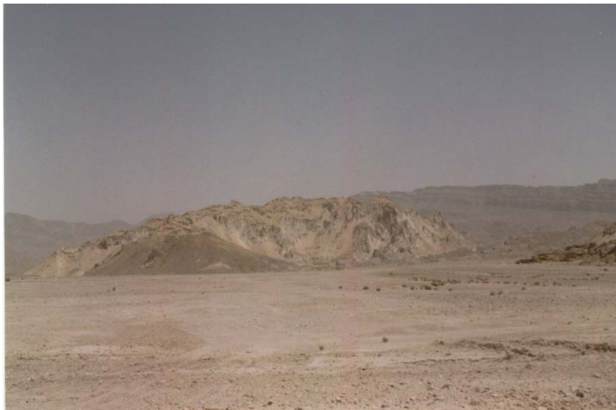
شکل ۱. سیمای طبیعی گنبد نمکی کرسیا در محدوده شهرستان داراب