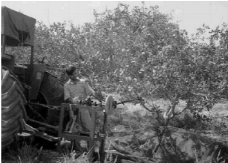
ب) تصویری از دستگاه شاخه تکان در حال ارتعاش شاخه

شکل ۱. تصاویری از مکانیزم انتقال حرکت و نحوه اتصال دستگاه شاخه تکان به هنگام اجرای یکی از آزمون‌ها