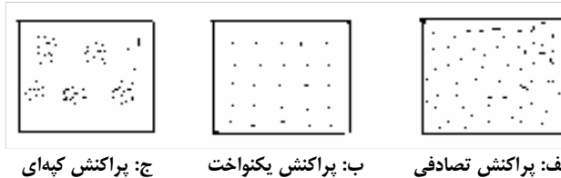
شکل ۱. سه نوع الگوی پراکنش گیاهان (اکولوژی آماری، لوودیک و رینولدز، ۱۹۷۵)

پوشش گیاهی این منطقه حدود ده درصد بوده به طوری که Artemisia sieberi با پوشش حدود ۹ درصد و تراکم آن در حدود ۰/۶۶ در متر مربع (۶۶۰۰ در هکتار) بوده و گونه‌های همراه آن Scariola orientalis , Salsola arbusculiformis با پوشش کمتر از یک درصد را شامل می‌شوند. تیپ گیاهی این منطقه Ar. Sa می‌باشد. این منطقه با وسعتی معادل ۸۱۰۵ هکتار بر روی دشت سرهای اپانداژ و لخت با حدود ارتفاعی ۱۹۶۰ تا