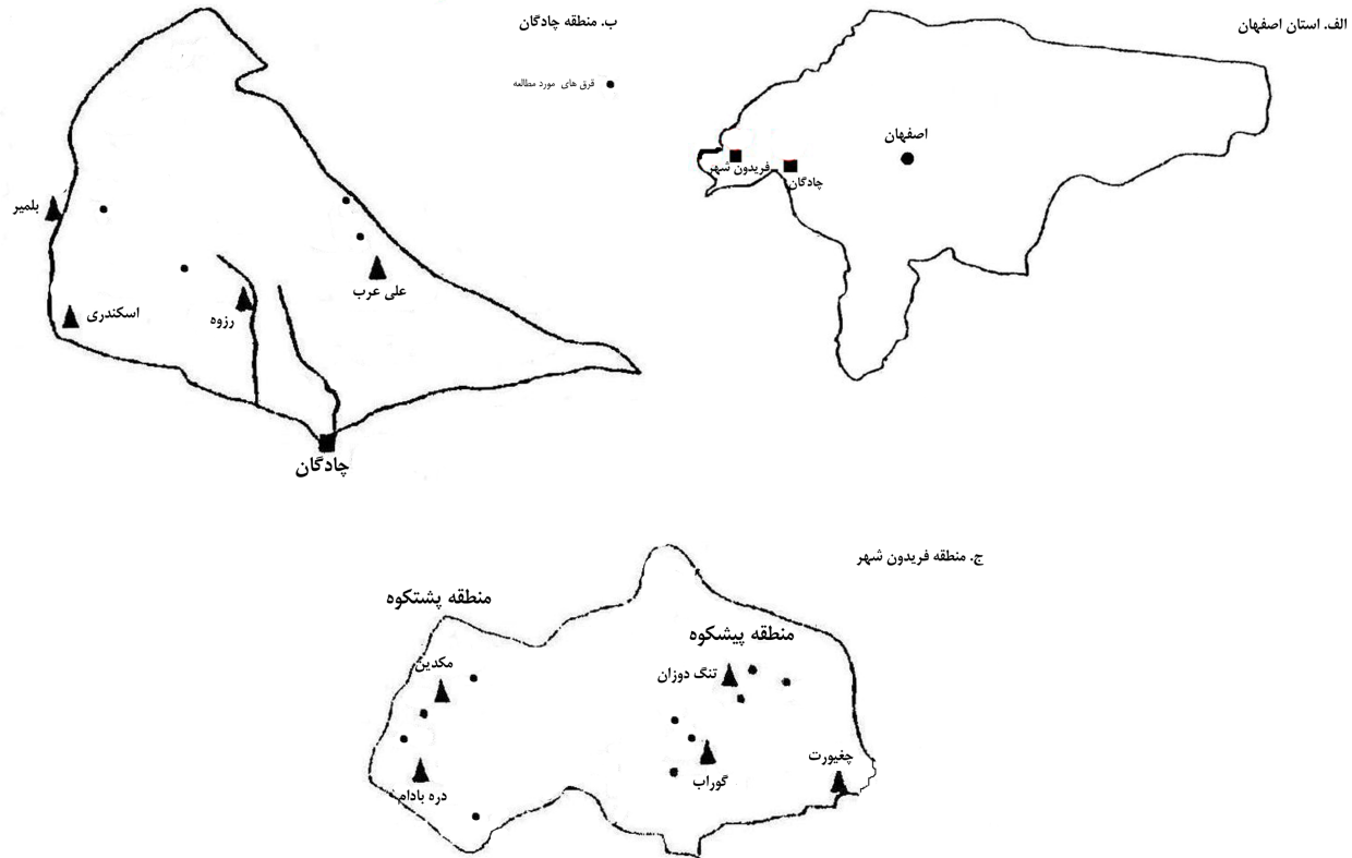
شکل ۱. موقعیت مناطق در استان اصفهان (الف) و محل فرق‌های نمونه برداری شده در شهرستان‌های چادگان (ب) و فریدون شهر (ج)

درصد گوسفند، ۲۰/۳ درصد بز و ۵ درصد گاو می‌باشد (۳). آمار رسمی نشان می‌دهد ۲۲/۸ درصد از جمعیت عشایری دارای پروانه بهره برداری از مرتع در دهستان پشتکوه قرار داشته و ۴۵/۸ درصد دام عشایری موجود در بخش فریدون شهر را دارا می‌باشند. شدت چرا در این منطقه ۰/۶۸ واحد دامی در هکتار می‌باشد. در صورتی که تنها ۱۷ درصد جمعیت عشایری و ۱۳ درصد دام عشایری موجود در بخش در منطقه پشتکوه چرا می‌نمایند و شدت چرا ۰/۳۸ واحد دامی در هکتار می‌باشد (۳). به نظر می‌رسد آمار واقعی بیش از این بوده و به طور کلی ۳۰ تا ۴۰ درصد دام موجود در این مناطق مازاد بر ظرفیت مراتع باشند (۳).