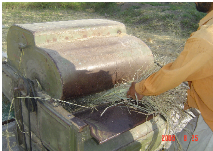
شکل ۱. خرمنکوب T 25 در حال کار

جدا و درصد وزنی دانه‌های آسیب دیده محاسبه و میانگین این سه نمونه به‌عنوان درصد ضایعات در هر آزمایش ثبت می‌گردید. دانه‌های آسیب دیده شامل دانه‌های شکسته شده و یا پوست‌گیری شده بودند که به‌وسیله چشم انسان قابل تشخیص بودند. برای تجزیه و تحلیل آثار اصلی و متقابل عوامل مستقل، از طرح آزمایش کرت‌های دو بار خرد شده در قالب بلوک‌های کامل تصادفی استفاده به‌عمل آمد و برای مقایسه میانگین‌ها، از آزمون دانکن (با استفاده از نرم‌افزارهای IRRISTAT) استفاده شد.