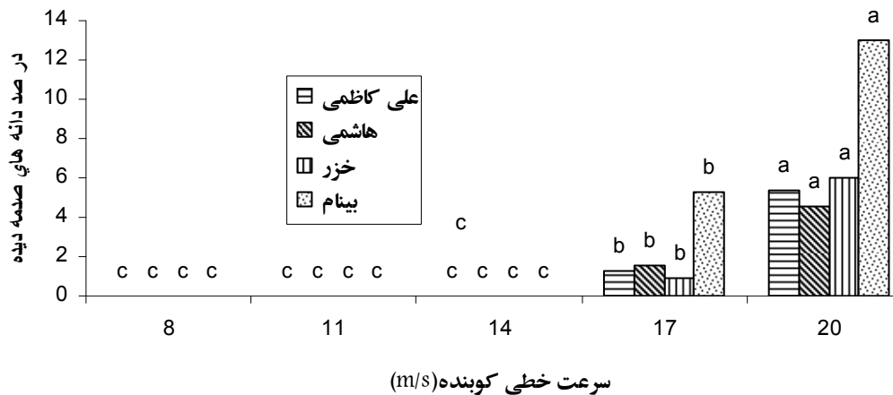
شکل ۳. اثرات متقابل نوع رقم در سرعت خطی کوبنده (V×N)