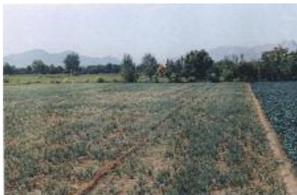
تصویر ۱. مزارع آلوده به بیماری ریشه سرخی پیاز در اصفهان