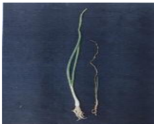
تصویر ۲. گیاهچه‌های پیاز آلوده به بیماری ریشه سرخی (بالا)، پیازهای بالغ آلوده به بیماری (پایین)

و بنفش رنگ شده و از بین رفته بودند و به راحتی از طبق گیاه پیاز جدا می‌شدند. در این خصوص، دو توده صفی‌آباد رامهرمز و سرباز بلوچستان قرار داشتند و از لحاظ طبقه‌بندی در طیف سوم (۲-۳) واقع شدند. این دو توده، از حساس‌ترین توده‌های مورد آزمون در این بررسی‌ها هستند که در این جا معرفی می‌گردند. بررسی‌هایی که سایر پژوهشگران در این خصوص ارائه نموده‌اند نیز به همین صورت عمل نموده و بعضاً در شرایط مزرعه و یا به صورت پلات‌های کوچک آلوده، انجام داده‌اند و ارقام و توده‌های مورد آزمون مربوطه خود را نسبت به این بیماری ارزیابی کرده‌اند (۸، ۱۰، ۱۱، ۱۴، ۱۵ و ۲۶).