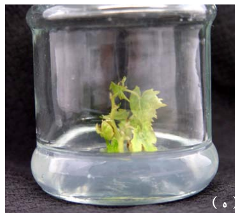
تصویر ۱. مطالعه اثر تنظیم‌کننده‌های رشد و نمک بر رشد شاخه: الف - ریزنمونه جوانه زده با قطر مناسب ساقه. ب - نمونه‌ای از شاخه‌رویی در محیط نمک MS با تنظیم‌کننده رشد BI. ج - رشد شاخساره در یکی از آزمایش‌ها در نمک WPM دو هفته پس از کشت. د - پرآوری در یکی از آزمایش‌ها در نمک WPM به مدت ۴۹ روز پس از کشت. ه - نمونه‌ای از شاخساره بدست آمده در محیط SEM برای طولیل شدن ساقه و رشد ریشه. و - پس از رشد کافی ریشه، شاخساره به خاک منتقل شده است.