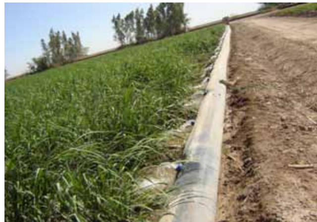
تصویر ۱. لوله هیدروفلوم در حالت آبیاری کامل

تیمار آزمایشی حدود ۱۰۰ متر مربع در طول شیار و از سه مکان مختلف، برداشت دستی صورت گرفت و تعداد نی در این محدوده نیز شمارش و به تن در هکتار و تعداد نی در هکتار تعمیم داده شد. هم‌چنین نمونه‌های ۲۰ نی (از هر تیمار سه نمونه ۲۰ نی به صورت تصادفی) جهت تعیین ویژگی‌های نیشکر از تیمارهای آزمایشی در موقع برداشت تهیه و پس از توزین و اندازه‌گیری ارتفاع آنها، با استفاده از دستگاه عصاره‌گیری از آنها عصاره‌گیری و با استفاده از دستگاه‌های ساکاریمتر و پلاریمتر مدل سوما، فاکتورهای کیفی چون درصد ساکاروز شربت نی (POL) و مقدار ذرات جامد محلول در شربت نی (Brix) اندازه‌گیری و با توجه به این فاکتورها، ویژگی‌های کیفی دیگر محاسبه شد. در پایان با توجه به حجم آب مصرفی و نیشکر و شکر تولیدی، کارایی مصرف آب برای هر تیمار محاسبه و تیمارها با هم مقایسه شدند.