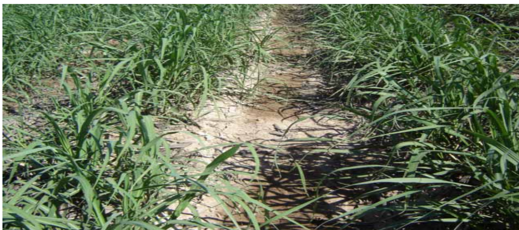
تصویر ۴. نحوه جریان آب از یک جویچه آبیاری شده به یک جویچه آبیاری نشده