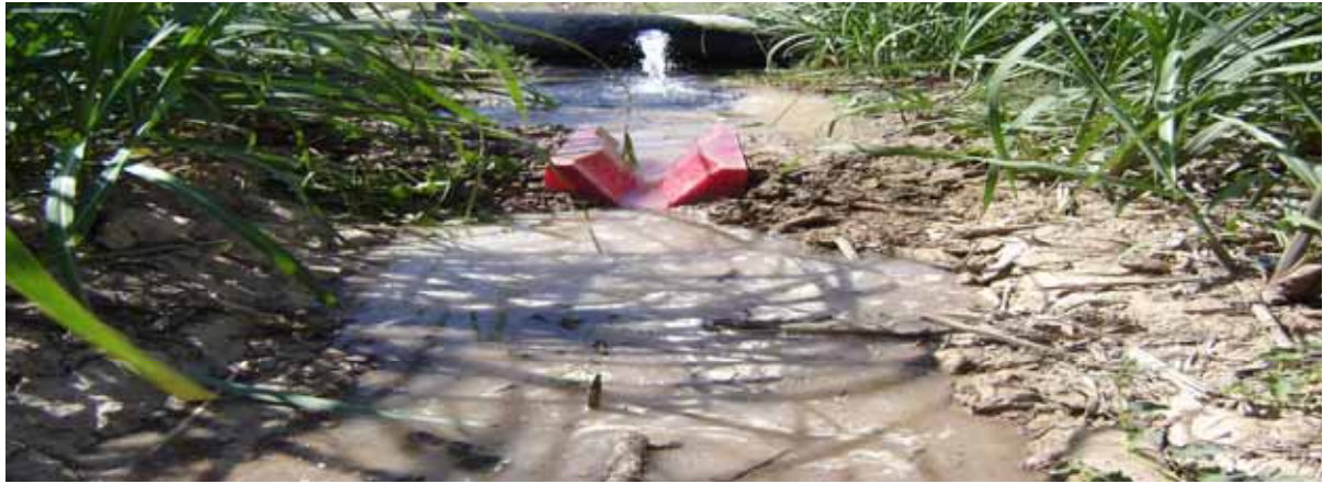
تصویر ۳. خروج آب از فلوم و پیشروی آب در جویچه

جدول ۲. برخی خصوصیات فیزیکوشیمیایی خاک تیمارها قبل از اجرای آزمایش در عمق متوسط ۱۰۰-۰ سانتی متری