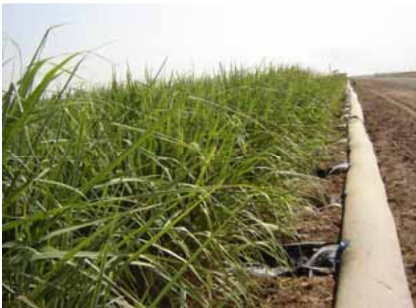
تصویر ۲. لوله هیدروفلوم در حالت آبیاری یک جویچه در میان