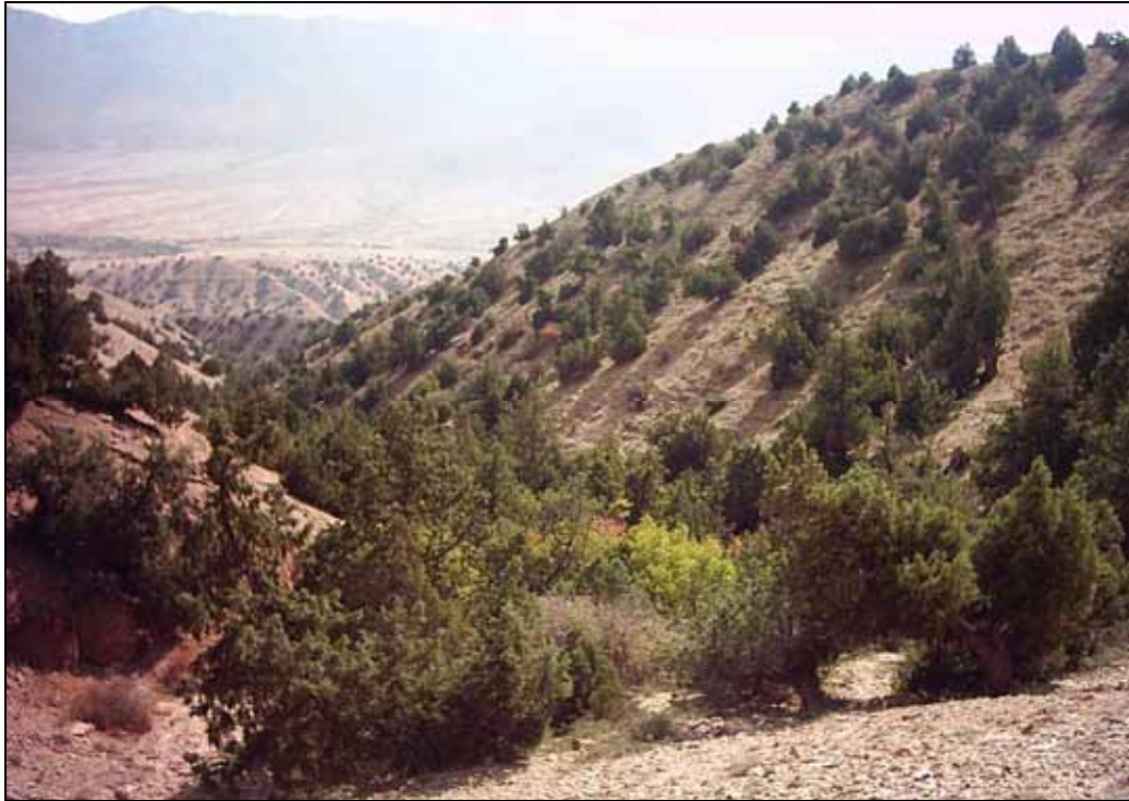
شکل ۳. درختان ارس Juniperus excelsa Bieb. در مناطق تخریب نیافته حوزه آبخیز پشتکوه

چرای مستقیم دام را نشان داده است (۲۴، ۲۸ و ۳۲). مطالعات انجام شده در کشور ما و به ویژه در گردنه چهارباغ نقش ارس‌های خزنده به خصوص Juniperus sabina را در امر حمایت از زاد آوری طبیعی نیز ثابت کرد به شکلی که در پناه یک بوته گسترده Juniperus sabina بیش از ۳۰ پایه درختی از گونه‌های مختلف شمارش شده است (۱۷). لازم به ذکر است گونه ارس Juniperus excelsa Bieb. در سطح حوزه پشتکوه و در طول سالیان دراز بخش‌هایی از دامنه‌های جنوبی و ارتفاعات پایینی دامنه‌های شمالی که دستخوش تخریب شدید اهالی منطقه بوده‌اند را به خود اختصاص داده است (شکل ۳). نهال‌های ارس نیز تنها گونه درختی می‌باشد که به صورت طبیعی در منطقه پشتکوه حضور دارد، از همین رو توجه بر تولید و تکثیر این گونه در عرصه آبخوانداری پشتکوه به همراه توسعه گونه‌های مرتعی در بین نهال‌های ارس (مرتع مشجر)، راهکاری متناسب با توسعه پایدار در سطح عرصه می‌باشد و این رویکرد با حداقل هزینه ضمن احیای جنگل‌های ارسستان حوزه پشتکوه، بیشترین تأثیر را بر روند توالی اکولوژیک