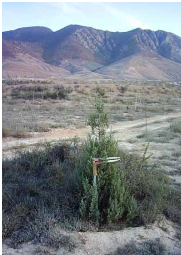
شکل ۲. نهال ارس Juniperus excelsa Bieb. در سطح ایستگاه تحقیقات آبخوان داری پشتکوه

نتایج تحقیق روی ارسستان‌های ایران نشان داده است اعمال قرق در رویشگاه‌های جزیره کبودان، چهارطاق اردل و لاین خراسان، افزایش زادآوری طبیعی این گونه را موجب شده است (۱۸). لازم به توضیح است زیستگاه گونه ارس در مناطق باز و مراتع کوهستانی قرار دارد. این گونه دامنه تحمل وسیعی از شرایط اکولوژیکی رویشگاه‌ها را داراست. بذر یا میوه‌های ارس توسط پرندگان کوهستان زی مانند کبک دری، کبک معمولی، تیهو و باقرقره به شدت مورد تغذیه قرار می‌گیرند و از مهم‌ترین عوامل حیاتی پراکنش این درختان نیز محسوب می‌شوند (۱۱). در ارتباط با ایستگاه تحقیقات آبخوان داری پشتکوه نیز به دلیل احداث کانال‌های آبرسان، نهرهای گسترشی و دروازه‌های عبور سیلاب جذب انواع گونه‌های پرندگان را در سطح عرصه آبخوان داری فراهم آورده است که از این جهت بر تکثیر طبیعی ارس تأثیری مثبت خواهد داشت. وجود