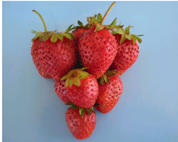
شکل ۲. نمونه‌های توت فرنگی ۲ ساعت پس از تیمار در محلول کلرید کلسیم

تازه‌خوری دارند توصیه نمود. ضمن آن که تلخی طعم حاصل از کاربرد املاح نیترات و تا حدی کلرید کلسیم نیز خود مزید بر علت است. به نظر می‌رسد روش محلول پاشی، قابلیت کاربرد در سطح تازه خوری این محصول را ندارد، اما استفاده از املاح سولفات و یا کلرید کلسیم (در غلظت‌های پایین) جهت آماده سازی نمونه قبل از اعمال فرایند انجماد برای نگه‌داری طولانی مدت و نیز برای توت فرنگی‌هایی که به مصرف تولید کنسانتره می‌رسند قابل بررسی است. چرا که به هر حال طی مرحله انجماد یا یخ‌زدایی توت فرنگی، حالت اولیه میوه تا حدی زایل می‌گردد و این امر حساسیت چندانی را ایجاد نمی‌کند ضمن آنکه کپک زدگی و لهیدگی محصول طی حمل و نقل کاهش می‌یابد. دسوزا، موریس و روزن (۱۰، ۱۵ و ۱۶) نیز توصیه مشابهی را برای محلول پاشی توت فرنگی با کلرید کلسیم به عمل آورده‌اند. به هر حال چنین به نظر می‌رسد که کماکان عملی‌ترین روش‌های کاهش ضایعات و افزایش عمر انبارداری محصول توت فرنگی برای مصارف تازه خوری، سرد کردن سریع محصول برداشت شده، جابه‌جایی و بسته‌بندی محصول در حجم‌های کوچک و ظروف کم عمق (حدود ۱۵ سانتی‌متر) و ذوزنقه‌ای شکل و استفاده از انبارهای سرد با دمای ۱- درجه سانتی‌گراد برای نگه‌داری کوتاه مدت محصول است.