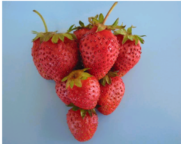
شکل ۲. نمونه‌های توت فرنگی ۲ ساعت پس از تیمار در محلول کلرید کلسیم

تازه‌خوری دارند توصیه نمود. ضمن آن که تلخی طعم حاصل از کاربرد املاح نیترات و تا حدی کلرید کلسیم نیز خود مزید بر علت است. به نظر می‌رسد روش محلول پاشی، قابلیت کاربرد در سطح تازه خوری این محصول را ندارد، اما استفاده از املاح سولفات و یا کلرید کلسیم (در غلظت‌های پایین) جهت آماده سازی نمونه قبل از اعمال فرایند انجماد برای نگه‌داری طولانی مدت و نیز برای توت فرنگی‌هایی که به مصرف تولید کنسانتره می‌رسند قابل بررسی است. چرا که به هر حال طی مرحله انجماد یا یخ‌زدایی توت فرنگی، حالت اولیه میوه تا حدی زایل می‌گردد و این امر حساسیت چندانی را ایجاد نمی‌کند ضمن آنکه کپک زدگی و لهیدگی محصول طی حمل و نقل کاهش می‌یابد. دسوزا، موریس و روزن (۱۰، ۱۵ و ۱۶) نیز توصیه مشابهی را برای محلول پاشی توت فرنگی با کلرید کلسیم به عمل آورده‌اند. به هر حال چنین به نظر می‌رسد که کماکان عملی‌ترین روش‌های کاهش ضایعات و افزایش عمر انبارداری محصول توت فرنگی برای مصارف تازه خوری، سرد کردن سریع محصول برداشت شده، جابه‌جایی و بسته‌بندی محصول در حجم‌های کوچک و ظروف کم عمق (حدود ۱۵ سانتی‌متر) و ذوزنقه‌ای شکل و استفاده از انبارهای سرد با دمای ۱- درجه سانتی‌گراد برای نگه‌داری کوتاه مدت محصول است.