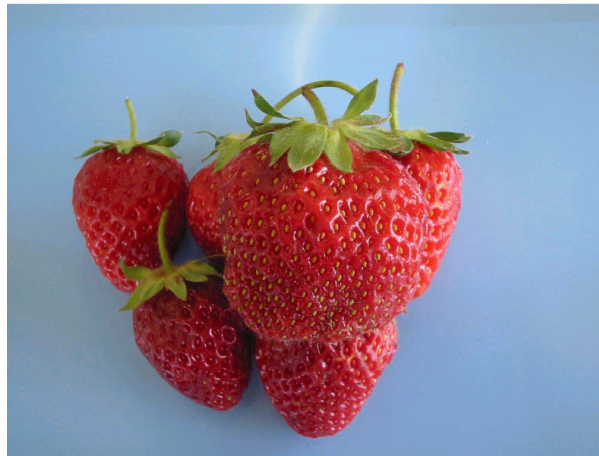
شکل ۱. نمونه‌های توت فرنگی قبل از اعمال تیمار

نتایج حاصل نشان می‌دهد که بین نمک‌های مختلف کلسیم نیز اختلاف معنی‌داری وجود دارد. نیترات کلسیم بالاترین و سولفات کلسیم کمترین اثر را در افزایش میزان کلسیم بافت دارا بودند. این نتیجه نیز با میزان حلالیت این نمک‌ها در محلول‌های مربوطه همخوانی دارد. اندازه‌گیری میزان کلسیم بافت در پایان روز پنجم و دهم نگهداری نمونه‌ها، نشان داد که میزان کلسیم نمونه‌ها با گذشت زمان به میزان اندکی افزایش میابد اما این افزایش معنی‌دار نبود. دسوزا، چانگ، چور و ویلموت و لیما (۷، ۸، ۱۰ و ۱۲) نیز اثرات مشابهی را در مورد رابطه بین میزان کلسیم بافت میوه‌ها و غلظت کلرید کلسیم مورد استفاده گزارش کردند.