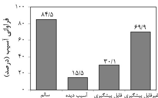
شکل ۴. صدمات وارد شده به توده پس از مرحله وینچینگ و خروج چوب‌آلات

عنوان نمودند که شدت آسیب وارده به توده باقی‌مانده در حفره‌های قطع با قطر برابر سینه درختان قطع شده هم‌بستگی مثبت دارد.