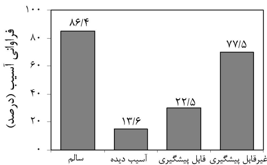
شکل ۲. صدمات وارد شده به توده پس از مرحله قطع و تبدیل درختان