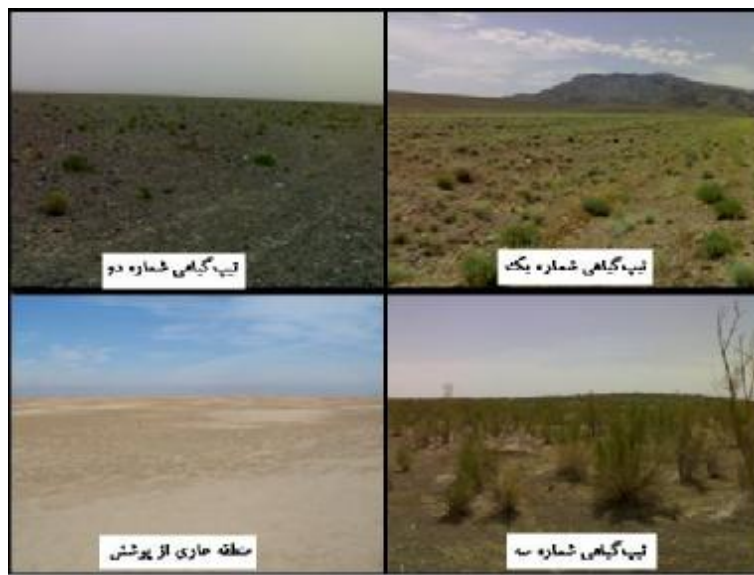
شکل ۱. سیمای عمومی چهار مکان مورد مطالعه در منطقه دق سرخ اردستان

تفاوت موجود بین خاک منطقه دارای پوشش و منطقه عاری از پوشش، آمار کمی ۲۲ عامل خاک مکان‌های چهارگانه بر اساس شاخص فاصله اقلیدوسی نسبی (به عنوان معیار فاصله‌ای)، به روش واریانس حداقل (واردز ۱۹۶۳) مورد تجزیه خوشه‌ای قرار گرفت. فاصله اقلیدوسی نسبی همانند فاصله اقلیدوسی است با این تفاوت که در آن داده‌ها به مقیاس طبیعی در آورده می‌شود. پردازش داده‌ها به وسیله نرم‌افزار PC-ORD تحت ویندوز (نسخه ۴/۱۷). پس از استانداردسازی انجام گرفت و نتایج طبقه‌بندی به صورت دندروگرام ترسیم شد. برای تشخیص نقش عامل‌های خاک در ساخت گروه‌های دندروگرام و اطمینان بیشتر از گروه‌بندی انجام شده، تجزیه واریانس یک طرفه با روش دانکن و بر مبنای طرح کاملاً تصادفی نامتعادل انجام گرفت (۱۲). تجزیه واریانس به وسیله نرم افزار SPSS نسخه ۱۵، تحت ویندوز انجام شد.