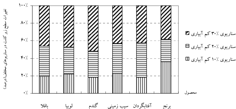
شکل ۳. مقایسه درصد تغییرات سطح زیر کشت در سناریوهای مختلف آبیاری