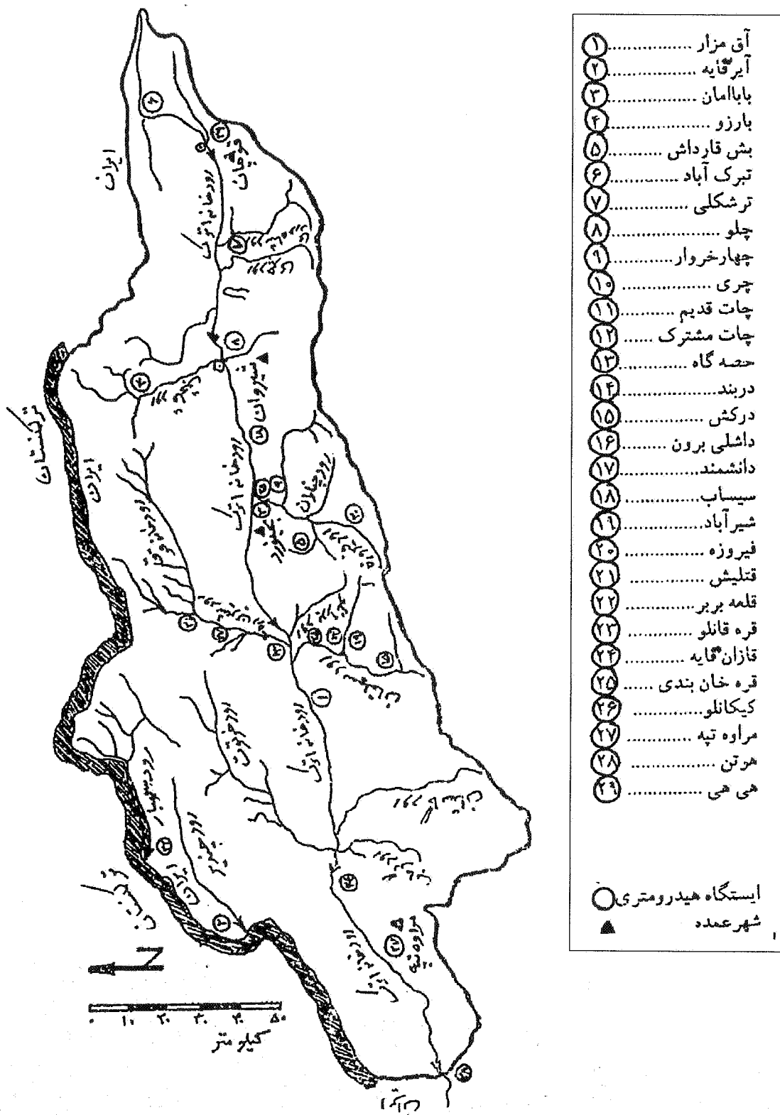
شکل ۲- موقعیت حوضه آبخیز اترک