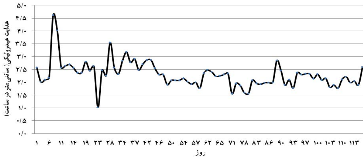
شکل ۱. تغییرات K در مدت انجام آزمایش