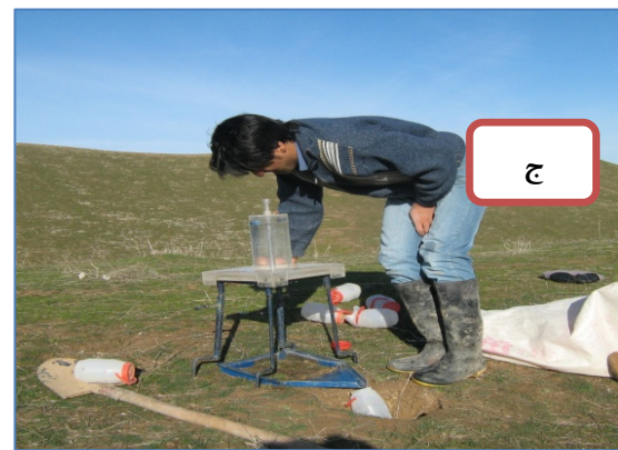
شکل ۱. مراحل مختلف نمونه برداری: شناسایی محل نصب پلات (الف)، مستقر نمودن پلات (ب)، نصب باران ساز بر روی پلات (ج) و انجام نمونه برداری و برداشت روان آب و رسوب (د).

تجزیه و آریانس مرکب برای خصوصیات خاک اعمال و روند تغییرات فصلی با تفکیک موقعیت شیب مورد بررسی قرار گرفت. نتایج در جدول ۲ و شکل ۳ ارائه شده است.