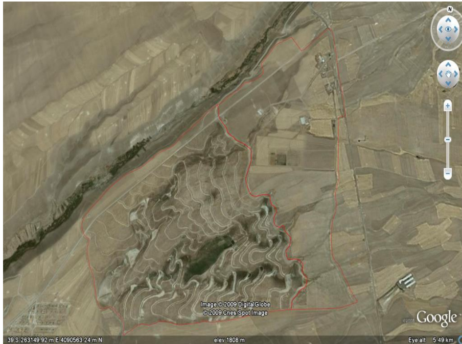
شکل ۱. تصویر ماهواره‌ای عرصه پخش سیلاب قره‌چریان در شمال غرب زنجان