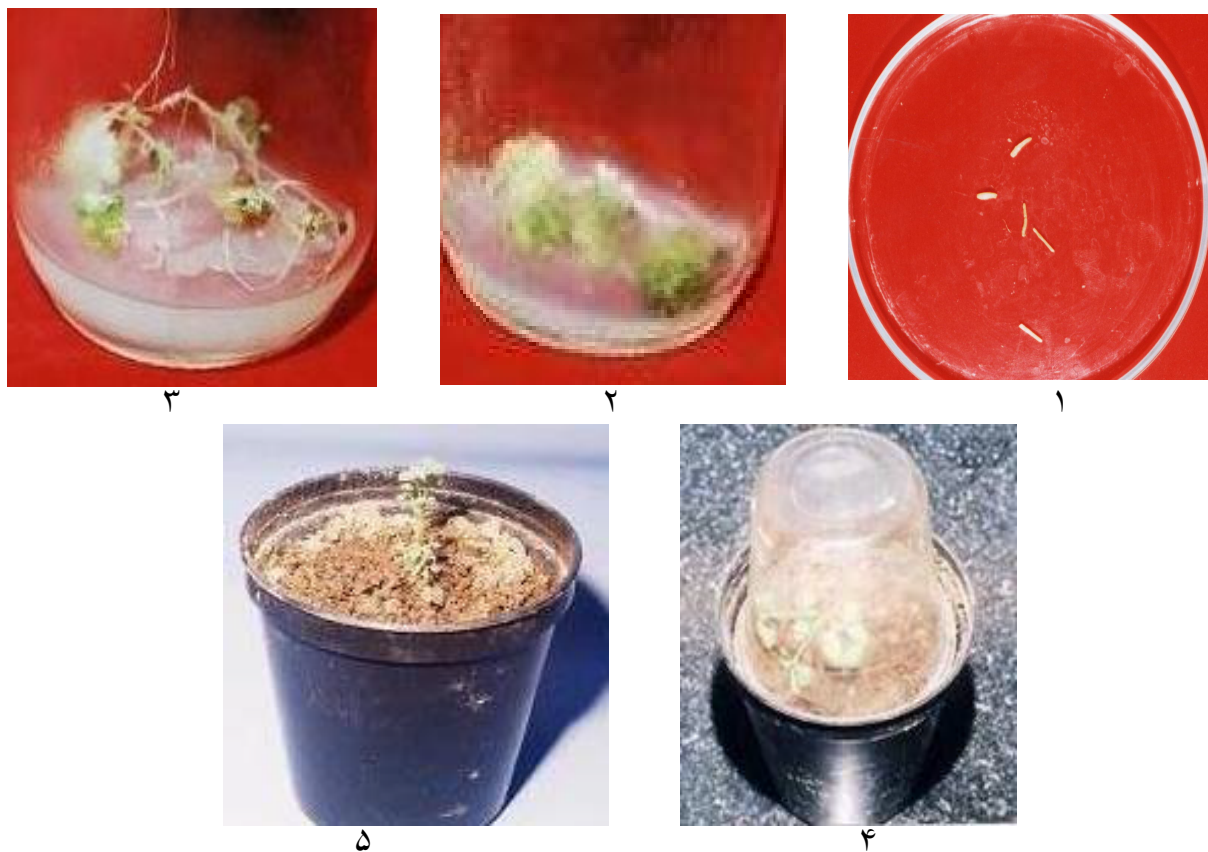
شکل ۴. مراحل مختلف باززایی گیاه یونجه از طریق ایجاد جین سوماتیک