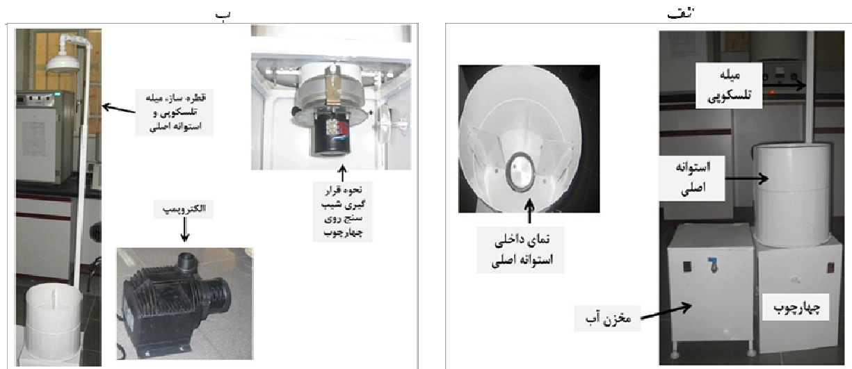
شکل ۱. دستگاه پاشمانی چندمتغیره، الف: میله تلسکوپ، چهارچوب، استوانه اصلی و نمای داخلی از نحوه قرارگیری استوانه نمونه‌گیری در داخل استوانه اصلی، ب: الکتروپمپ، قطره‌ساز میله تلسکوپ و استوانه اصلی و نحوه قرارگیری شیب‌سنج روی چهارچوب

و عامل سوم شیب با دو سطح (۵ و ۱۵ درصد) در قالب طرح کاملاً تصادفی در سه تکرار اجرا شد. محاسبات آماری نتایج به‌وسیله نرم‌افزارهای SAS 9.1 و SPSS/ver.16 صورت گرفت.