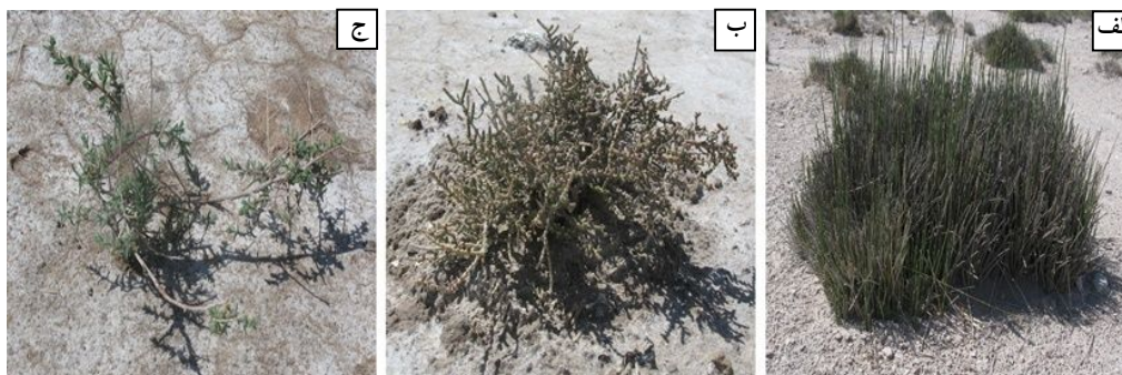
شکل ۲. سه گونه گیاهی مورد مطالعه شامل: (الف) Juncus gerardi ، (ب) Halocnemum strobilaceum و (ج) Salsola rigida

رطوبت اشباع خاک نیز تحت تأثیر گونه گیاهی قرار گرفت، به طوری که گیاه Juncus gerardi سبب افزایش مقدار رطوبت اشباع خاک شد. اندازه گیری پ- هاش در نمونه های خاک نشان داد که گیاه Juncus gerardi سبب کاهش پ- هاش در خاک سطحی زیر گیاه نسبت به خاک زیر سطحی و همچنین خاک بین گیاه شده است. Halocnemum strobilaceum تأثیری بر مقدار پ- هاش خاک نداشت. در زیر گیاه Salsola rigida مقدار پ- هاش خاک سطحی کمتر از خاک زیر سطحی بود که این تفاوت برای نمونه های بین گیاه نیز دیده شد. قابلیت هدایت الکتریکی در خاک زیر Juncus gerardi در افق سطحی و زیر سطحی بدون تفاوت اما به طور قابل ملاحظه ای کمتر از خاک بین گیاه بود. در بین گیاه نیز شوری خاک سطحی بیشتر از خاک زیر سطحی اندازه گیری شد. گونه Halocnemum strobilaceum تأثیری بر شوری خاک نداشت اما سبب یکنواخت شدن شوری در افق سطحی و زیر سطحی شد. گونه Salsola rigida نیز تأثیری بر شوری خاک نداشت؛ اما در زیر گیاه و بین گیاه، خاک سطحی بسیار شورتر از خاک زیر سطحی بود. با توجه به این که این گونه گیاهی دارای تراکم کمتر نسبت به دو گونه دیگر بوده و در نتیجه مقدار بازگشت بقایای گیاهی به سطح خاک کمتر بوده و این سبب تأثیر غیرمعنی دار این گونه بر مقدار املاح خاک می شود. از طرف دیگر حفاظت خاک به وسیله این گیاه با توجه به الگوی رشد و پراکنش آن ضعیف بوده و ممکن است فرسایش آبی و سیلاب های ایجاد شده سبب یکنواخت شدن املاح محلول در خاک زیر گیاه و بین