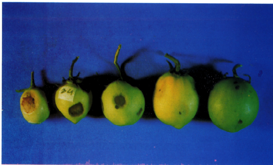
شکل ۱. مایه‌زنی میوه‌های نارس گوجه فرنگی با جدایه‌های شماره ۲۴ (بادام) و ۳۱ (کندم) Pseudomonas syringae pv. syringae (گوجه فرنگی سمت راست مایه‌زنی شده با جدایه غیر پاتوژن، شاهد منفی)