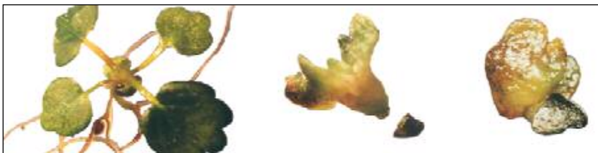
الف. رشد گیاهچه ۲ روز بعد از کشت ب. رشد گیاهچه ۴ روز بعد از کشت ج. رشد دانه‌های توت فرنگی ۷ روز بعد از کشت

تصویر ۲. مراحل جوانه‌زنی بذر نصف شده توت فرنگی حاوی گیاهچه در محیط کشت درون شیشه ( In vitro )