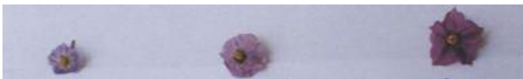
شکل ۲. شکل گل‌ها در والدین و هیبرید به ترتیب از راست به چپ: فورا، هیبرید فورا \times آکول و آکول