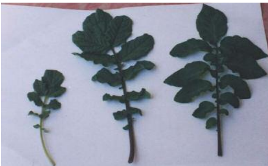
شکل ۱. شکل برگ‌ها در والدین و هیبرید به ترتیب از راست به چپ: فوراً، هیبرید فوراً \times آکول و آکول