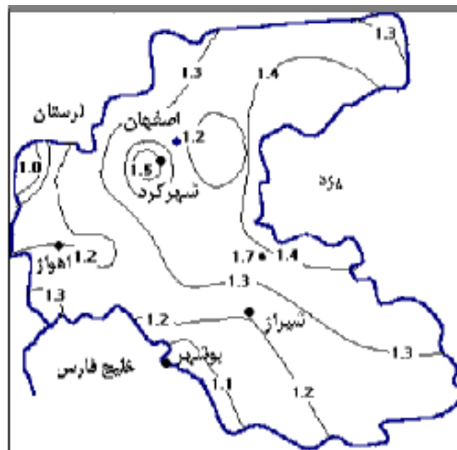
شکل ۳. توزیع جغرافیایی نسبت R_{EI}/R_b برای منطقه مورد بررسی

آبادیه در شمال شرقی شیراز)، که نشانه تأثیر شدیدتر این پدیده بر بارندگی این ایستگاه است. با این وجود، گرچه وقوع ال نینو در سال‌های ۱۳۵۶، ۱۳۷۰، ۱۳۷۱، ۱۳۷۳ و ۱۳۷۶ شمسی، برابر انتظار، افزایش شدید بارندگی در ایستگاه آبادیه را موجب شده،