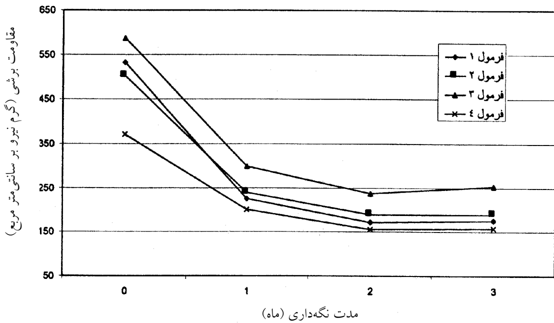
شکل ۱. تأثیر نوع فرمولاسیون و مدت نگهداری بر میزان مقاومت برشی بافت سوسیس‌های کنسرو شده برای دو نوع ظرف (میانگین دو نوع ظرف)