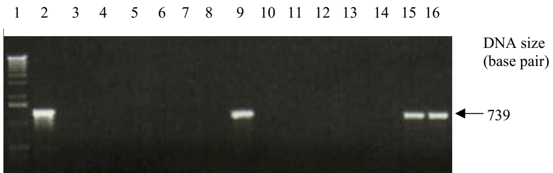
شکل ۵. نتایج آزمون PCR برای ریشه‌های مویین تراریخته BinOF2 برای تشخیص ژن GUS