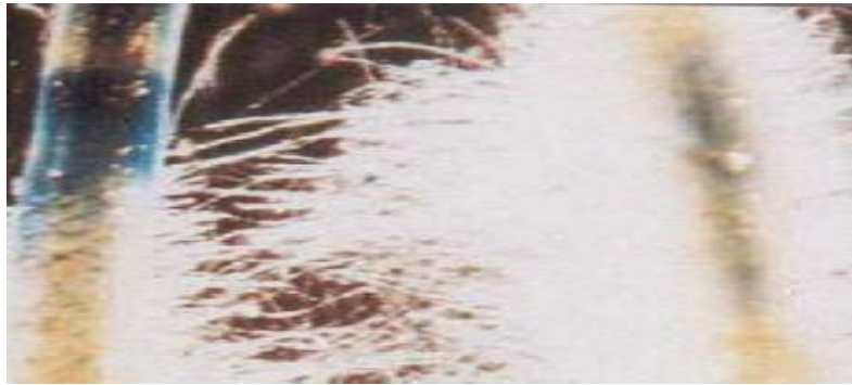
شکل ۴. ریشه‌های مویین تراریخته حامل ژن GUS با پروموتور CaMV35S پس از رنگ‌آمیزی. لکه‌های آبی در ریشه‌های مویین بیان ژن GUS را نشان می‌دهند.