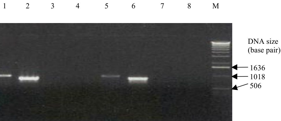
شکل ۳. نتایج PCR دو نمونه پلاسمید نوترکیب pAM-FLVAP با به اختصار pAMVAP با آغازگرهای مختلف برای تأیید همسو بودن جهت ژن VAP در مجاورت پروموتور CaMV35S