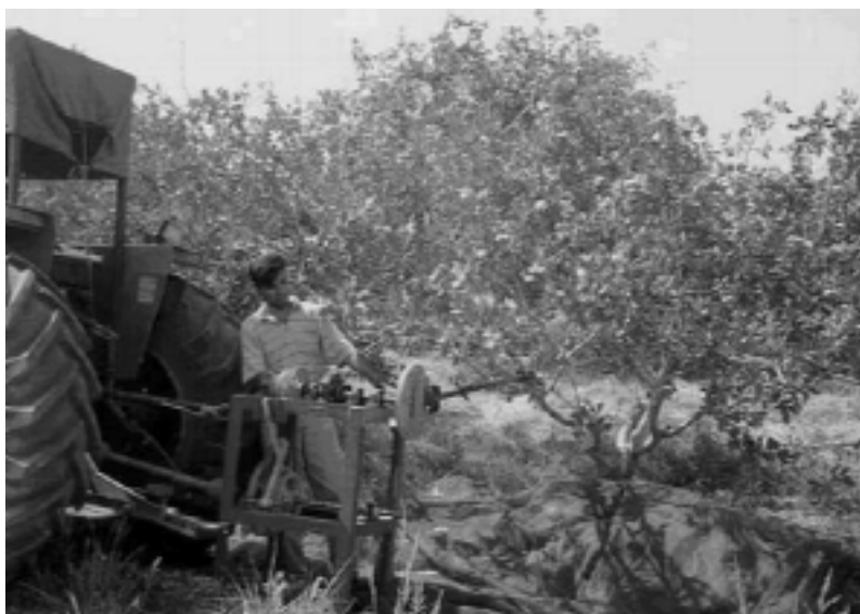
ب) تصویری از دستگاه شاخه تکان در حال ارتعاش شاخه

شکل ۱. تصاویری از مکانیزم انتقال حرکت و نحوه اتصال دستگاه شاخه تکان به هنگام اجرای یکی از آزمون‌ها