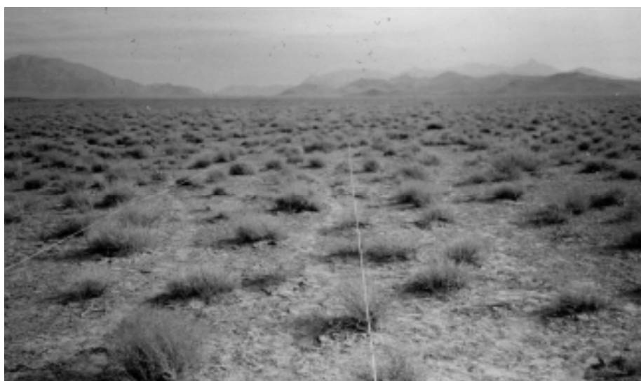
شکل ۳. منطقه حسن آباد ندوشن یزد

می‌باشد. تیپ گیاهی این منطقه Ar. AS می‌باشد. این منطقه با وسعتی معادل ۵۸۱۷ هکتار بر روی دشت سرهای لخت و اپانداژ با حدود ارتفاعی ۲۴۰۰ متر قرار دارد. نوع خاک لومی شنی، اقلیم خشک سرد و میانگین بارندگی در حدود ۲۰۰ میلی‌متر می‌باشد (۱) (شکل ۴).