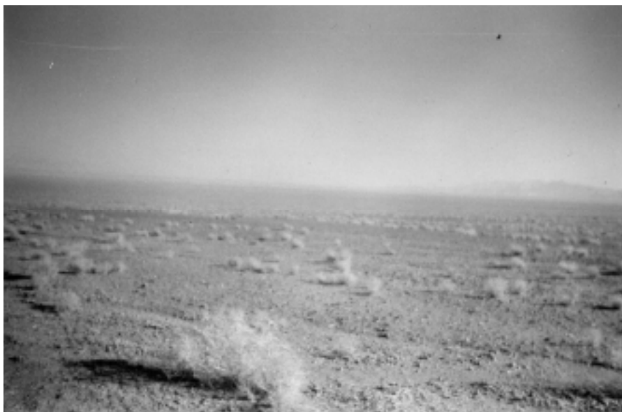
شکل ۲. منطقه فولاد میبد ندوشن یزد