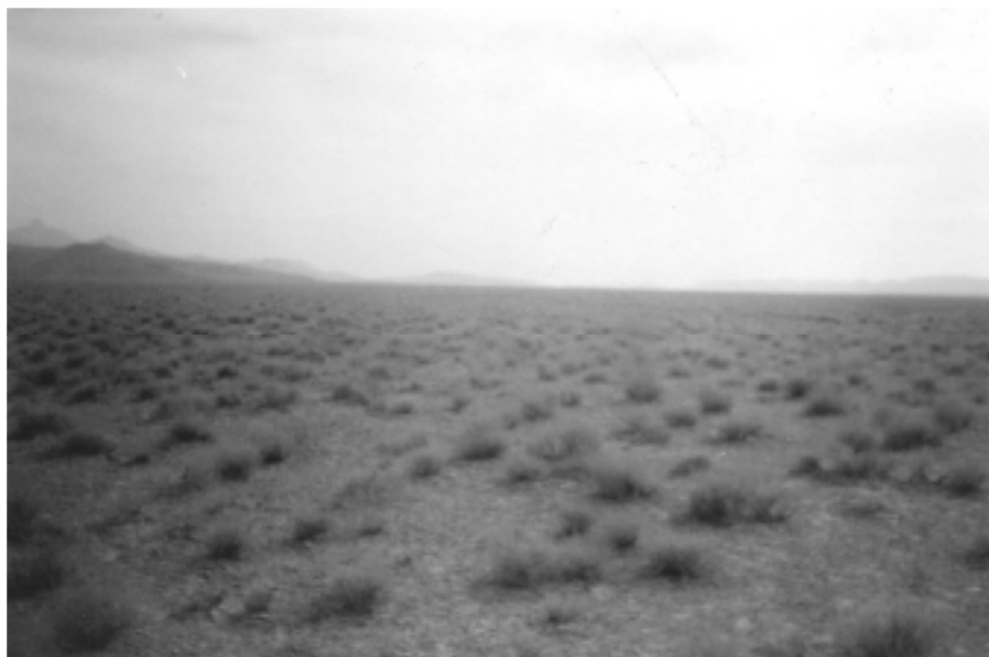
شکل ۴. منطقه صدرآباد ندوشن یزد

کوادراتی محاسبه شده در سطح احتمال ۵ درصد با استفاده از تست آماری مربوط به همان شاخص آزمون شد تا اختلاف هر یک از پراکنش تصادفی مشخص گردد (۱۰). برای مقایسه شاخص‌های الگوی پراکنش از نظر دقت، از طرح کاملاً تصادفی و جدول تجزیه واریانس استفاده شد، بدین ترتیب که واریانس بین ۱۲ عدد به دست آمده از هر شاخص در سه منطقه محاسبه و سپس (MSE) میانگین مربعات خطای آزمایشی و (SE) خطای استاندارد برای هر شاخص محاسبه گردید.