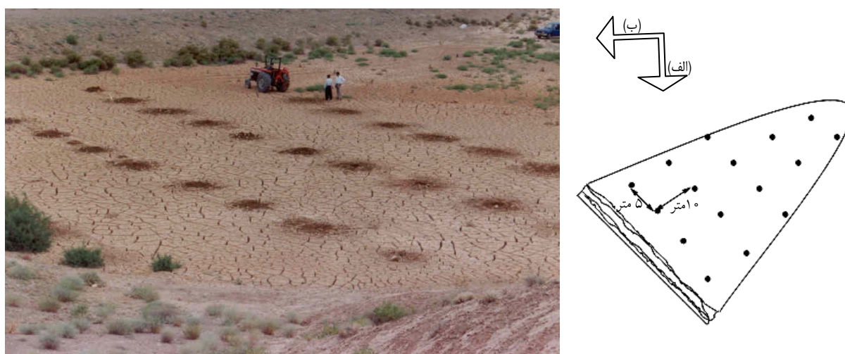
شکل ۲. محل‌های نمونه برداری در مخازن سدها (الف) و نمونه‌ای از مناطق حفر چاهک‌های گمانه‌ای در مخزن سد عمران (ب)