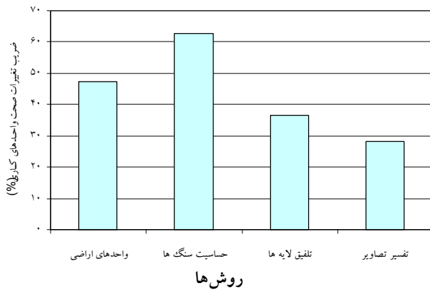
شکل ۳. دقت روش‌های مورد استفاده در تهیه نقشه شکل‌های فرسایش