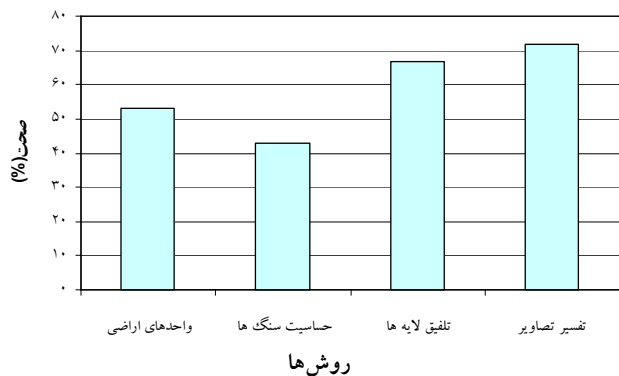
شکل ۱. صحت روش‌های مورد استفاده در تهیه نقشه شکل‌های مختلف فرسایش

شکل ۲ جذر میانگین مربعات خطای واحدهای کاری را نشان می‌دهد. این شاخص نیز نشان می‌دهد که روش تفسیر تصاویر ماهواره‌ای از خطای کمتری در تهیه نقشه شکل‌های فرسایش برخوردار است. اختلاف خطا با روش واحدهای اراضی و حساسیت سنگ‌ها بسیار زیاد است اما با روش تلفیق لایه‌ای اختلاف بسیار کمتری دارد.