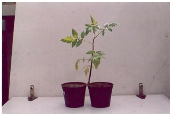
شکل ۱. تقسیم ریشه گیاه در دو گلدان مجاور برای مطالعه تأثیر سیستمیک نماتود مولد گره ریشه Meloidogyne javanica بر میزان بیماری و فعالیت آنزیم فنیل آلانین آمونیلایز در تعامل با قارچ عامل بیماری پژمردگی فوزاریومی گوجه فرنگی Fusarium. oxysporum fsp lycopersici

واريته Roma VF و مدت زمان لازم برای رسیدن به ظهور بالغ‌های جوان به ترتیب دو روز و ۱۵ روز بر اساس صاحبانی در نظر گرفته شد (۱).