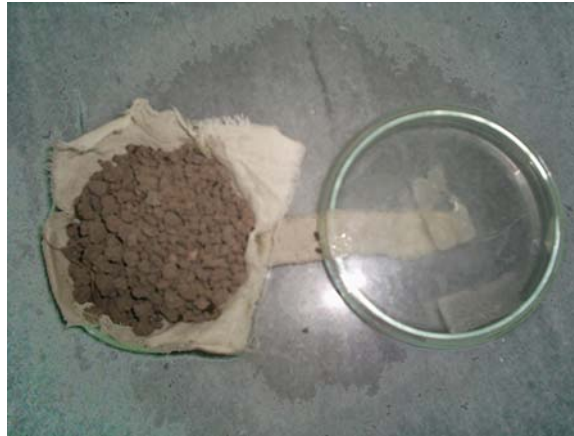
شکل ۱. پل آبی برای انتقال آب به ظرف دارای خاکدانه‌ها

اندازه‌گیری مقاومت کششی خاکدانه‌ها (۹) در رطوبت هوا-خشک و مکش ماتریک 500 \text{ kPa} استفاده شد. آزمایش‌های اولیه نشان داد که به دلیل پایداری اندک خاک‌های مورد بررسی، مقاومت کششی خاکدانه‌ها در مکش‌های ماتریک کمتر از 500 \text{ kPa} ناچیز بوده و تغییر شکل آنها عمدتاً خمیری و ماندگار می‌باشد که با اصول روش غیرمستقیم برزیلی مغایرت دارد. خاکدانه‌های با اندازه 3-8 \text{ mm} به روش الک خشک جدا شده و ۳۰ عدد از آنها به‌طور تصادفی برای هر آزمایش انتخاب و وزن شدند. برای تیمار مکش ماتریک 500 \text{ kPa} ، ۳۰ عدد از خاکدانه‌های مذکور انتخاب شده و مکش ماتریک آنها با استفاده از پل آبی (شکل ۱) به 500 \text{ kPa} رسانده شد. خاکدانه‌ها بین دو صفحه بارگذاری (با استفاده از دستگاه تک محوری (Uniaxial compression test)) شکسته شده و مقاومت کششی آنها به کمک رابطه زیر محاسبه شد: