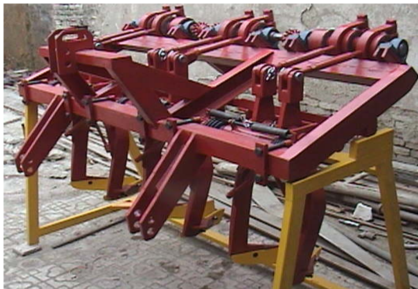
شکل ۱. چغندرکن ارتعاشی مورد آزمایش بدون واحد کنارزن برگ و ردیف کن (نمونه مشابه اونزین).

میله رابط با بازو ارتباط دارد (۴ در شکل ۲). دوران محور عرضی توسط این بشقاب‌های خارج از مرکز و میله‌های رابط به بازوها، که در نقطه اتصال به شاسی حالت لولایی دارند (۳ در شکل ۲)، منتقل شده و به آنها حرکت نوسانی می‌دهد.